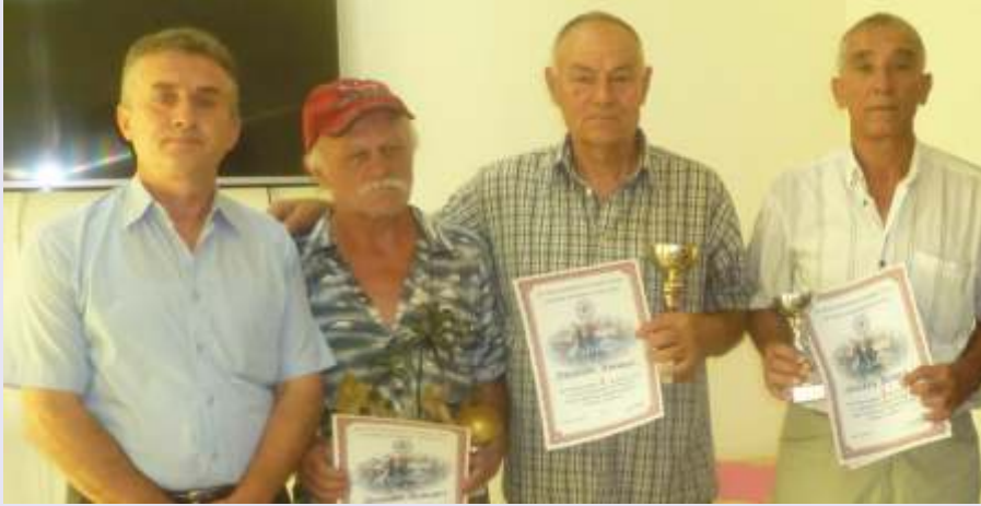
Pobjednici šahovskog turnira sa nagradama